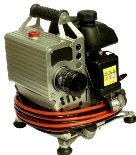
Насосная бензиновая станция с распределителем НБР18/82-50-34 в комплекте с БУ-34 и РВД3000-34