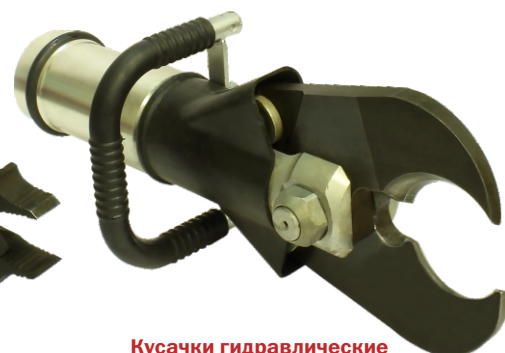
Кусачки гидравлические К30-34

Диаметр перекусываемого прутка – до 25 мм Максимальная величина разжима – 235 мм Усилие стягивания – 4,2 тс Усилие расширения – 3 тс Масса – 9 кг