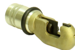
Кусачки гидравлические К18-34

Минирасширитель угловой с величиной разжима до – 80мм Масса – 3,2 кг