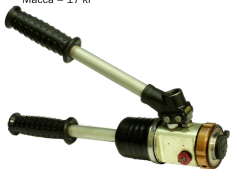
Насос ручной гидравлический НРГ8003-34

Диаметр перекусываемого прутка до – 30 мм Масса – 12 кг