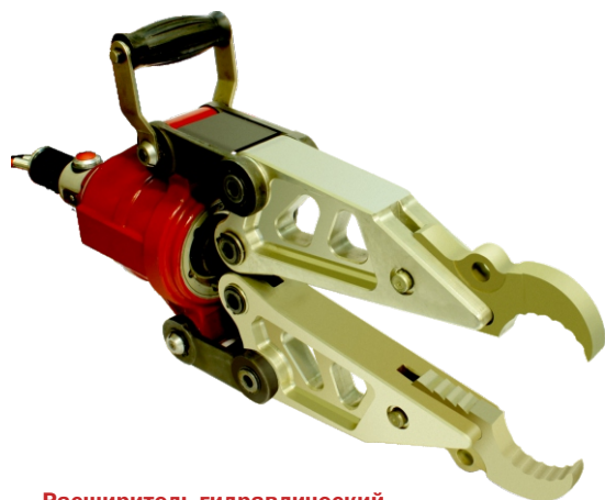
Расширитель гидравлический Р580-34

Максимальная величина разжима – 580 мм Масса – 17 кг