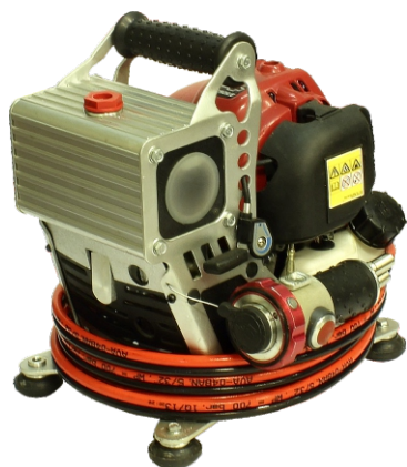
Насосная бензиновая станция с распределителем НБР18/82-25Р-34 ранцевая в комплекте с БУ-34 и РВД3000-34