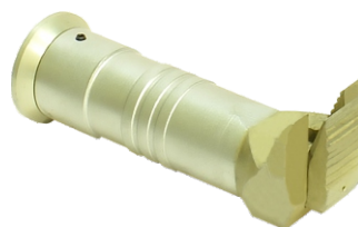
Расширитель гидравлический РУ80-34

Минирасширитель с величиной разжима до – 80 мм Масса – 4,5 кг