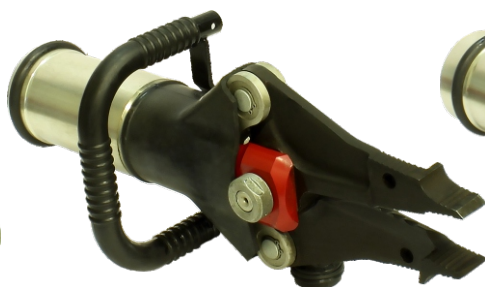
Ножницы универсальные комбинированные гидравлические НУК25/235-34

Максимальная величина разжима – 580 мм Масса – 17 кг