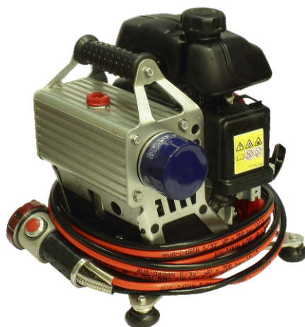
Насосная бензиновая станция с распределителем НБР18/82-35-34 в комплекте с БУ-34 и РВД3000-34