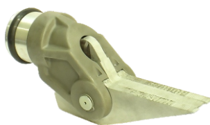
Расширитель гидравлический Р80-34

Давление – 80 МПа Объем бака – 0,3 л Масса – 2,5 кг